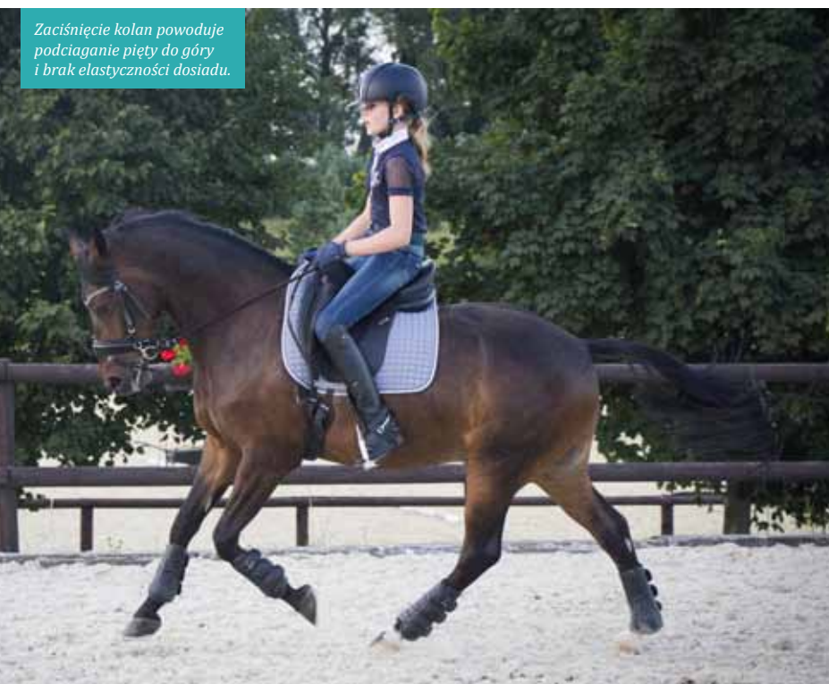
Zaciśnięcie kolan powoduje podciąganie pięty do góry i brak elastyczności dosiadu.

Ważną rolę odgrywa tutaj prawidłowe dopasowanie długości strzemion – zarówno za długie, jak i za krótkie będą utrudniały utrzymanie równowagi. Dłuższe strzemiona stosujemy na lepiej ujeżdżonym koniu, krótsze - gdy