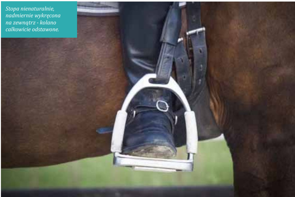
Stopa nienaturalnie, nadmiernie wykręcona na zewnątrz - kolano całkowicie odstawione.

Dużo lepszy efekt osiągniemy myśląc, mówiąc "palce stopy do góry" - dzięki temu brzusec łydki jeźdźcy napina się i nasza łydka ma większą skuteczność, a kolano i biodro mogą pozostać w rozluźnieniu i pracować niezależnie. Kolejną komendą, na którą trzeba uważać, jest