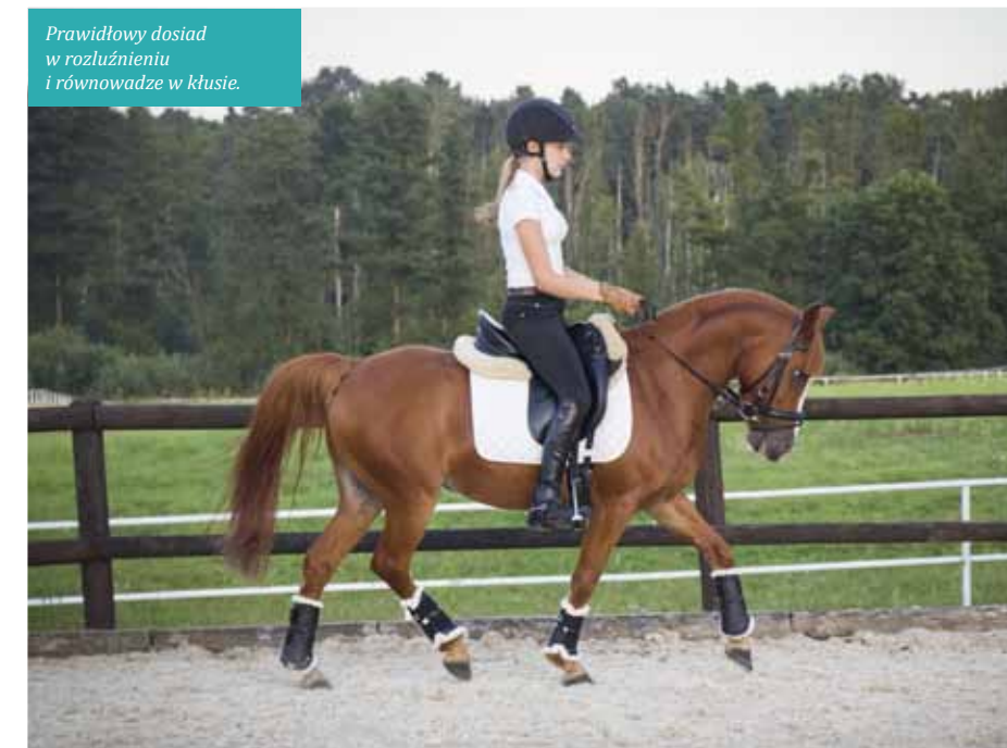
Prawidłowy dosiad w rozluźnieniu i równowadze w klusie.

Idealną pomocą w pracy nad dosiadem jest obecność luster na ujeżdżalni, dzięki czemu na bieżąco możemy skontrolować, czy np. nasza pięta, biodro, ramię, ucho leżą w jednej linii prostopadle skierowanej do podłoża. Jeżeli nie posiadamy takiego luksusu, to równie pomocne może być nagranie krótkiego filmiku przez osobę z zewnątrz. Warto postarać się o taką kontrolę, gdyż często wydaje się nam, że siedzimy prosto, a pięta jest najniższym punktem jeźdźcy - rzeczywistość bywa zupełnie inna. Świadomość pracy naszego ciała jest bardzo ważną umiejętnością i warto ją trenować, niezależnie od poziomu jeździeckiego, na jakim się znajdujemy. Najłatwiej oczywiście pracować z ułożeniem naszego ciała w stępie i od tego chodu należy zacząć